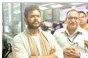
एजेसी | नई दिल्ली

◆ मंत्रालय हवाई अड्डों और एयरलाइनों पर परिचालन पर लगातार निगरानी रख रहा है ताकि यात्रा और रिफंड का ध्यान रखा जा सके