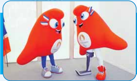
पेरिस ओलंपिक खेलों का शुभकर-फ्रीजेस

फ्रांस की राजधानी पेरिस में तीसरी बार ओलंपिक खेलों का आयोजन (26 जुलाई से 11 अगस्त तक) किया जा रहा है। पहली बार 1900 में आयोजन हुआ था और दूसरी बार अब से ठीक 100 साल पहले यानी 1924 में। इस बार के ओलंपिक खेलों को 'गेम्स वाइड ओपन' कहा जा रहा है। इस बार के ओलंपिक खेलों में कौशिका यह की जा रही है कि हर चार वर्ष के अंतराल पर आयोजित किए जाने वाले इन ग्रीष्मकालीन खेलों में कुछ ऐसे नए प्रयोग किए जाएं कि इनकी लोकप्रियता और बढ़े। इसके लिए इंटरनेशनल ओलंपिक कमिटी (आईओसी) ने कुछ नई पहल की है, ताकि नए बेंचमार्क स्थापित किए जा सकें और भविष्य की पीढ़ियों के लिए यह संवेदनशील और जिम्मेदार खेलों के रूप में उभर सकें। इस बार लगातार तीसरी बार रिप्यूजी ओलंपिक टीम को खेल के मैदान में उतारा जाएगा। इस टीम में उन क्षेत्रों के