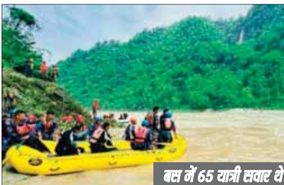
एजेसी ॥ नई दिल्ली

नेपाल में भूस्खलन से त्रिशूली नदी में लापता हुए 62 यात्रियों में से 38 लोगों की खोज अब भारतीय टोही दल करेगा। इसके लिए नेपाल सरकार के आग्रह पर 12 लोगों का टोही दल घटनास्थल पर पहुंच चुका है। नारायणगढ़ मुगलिंग सड़क खंड में सिमलताल के पास भूस्खलन होने से त्रिशूली नदी में लापता दो बस और उन पर सवार यात्रियों की खोज अब भारतीय टोही दल करेगा।