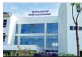
हरिभूमि न्यूज | इंदौर

◆ ईमेल में कहा गया है कि स्वतंत्रता दिवस यानी 15 अगस्त को स्कूल को बम से उड़ा दिया जाएगा