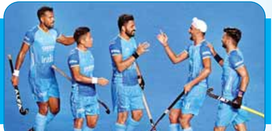
पदक जीतने के लिए तैयार है भारतीय हॉकी टीम

इसी सप्ताह शुरू होने वाले 33वें पेरिस ओलंपिक खेलों से हर भारतीय को चमत्कार की उम्मीद है। हर भारतीय खेल प्रेमी को विश्वास है कि इस बार भारत के खिलाड़ी दस से अधिक मेडल्स जीतेंगे। टोकियो ओलंपिक में भारत को एक स्वर्ण, दो रजत और चार कांस्य पदक मिले थे और हम पदक तालिका में 48वें नंबर पर रहे थे। टोकियो ओलंपिक में भारत ने अपना अब तक का सबसे बड़ा खिलाड़ी दल उतारा था, जिसने भारत के ओलंपिक इतिहास में सबसे ज्यादा पदक भी जीते थे। लेकिन ये पदक महज सात थे। एथलेटिक्स में एक, कुश्ती में दो, भारोत्तोलन में एक, हॉकी में एक, मुक्केबाजी में एक और बैडमिंटन में एक।