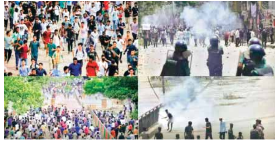
एजेसी ॥ ढाका

बांग्लादेश इस समय आरक्षण की आग में जल रहा है। आरक्षण प्रणाली में सुधार की मांग को लेकर छात्रों के विरोध प्रदर्शन के दौरान राजधानी ढाका तथा अन्य जगहों पर हिंसा भड़क गई है। इसमें करीब 105 व्यक्तियों की मौत हो चुकी है, कई घायल हुए हैं।